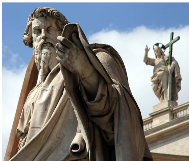
St Paul, Basilique St Jean du Latran, Rome

On peut aussi ouvrir la rencontre par une prière à l'Esprit Saint (la prière écrite par Mgr Le Saux l'année précédente, le Veni Creator « Viens Esprit créateur », ou un chant à l'Esprit Saint)